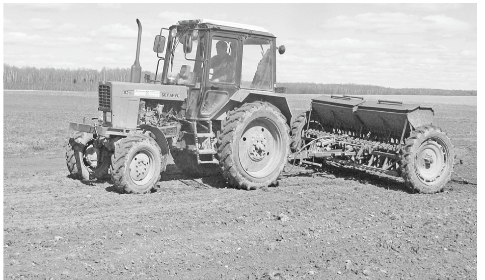
Сев зерновых в КФХ Волчкова.

По сравнению с прошлым годом количество обрабатываемых сельхозугодий увеличится на 5%: