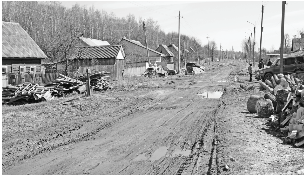
Улица Пушкина. Есть над чем работать...

Разные улицы есть у нас. Широкие и узкие, длинные и короткие, ухоженные и захлапленные... Каждая - это лицо живущих здесь людей.