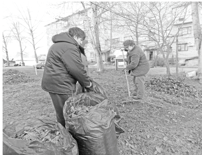
Жильцы дома №31 по улице Ленина провели первый субботник.

глядят новенькими, рядом тоже все нормально: нет ни строительных куч, ни штабелей с бревнами, ни сухой травы... Порядок. Вот бы везде так!