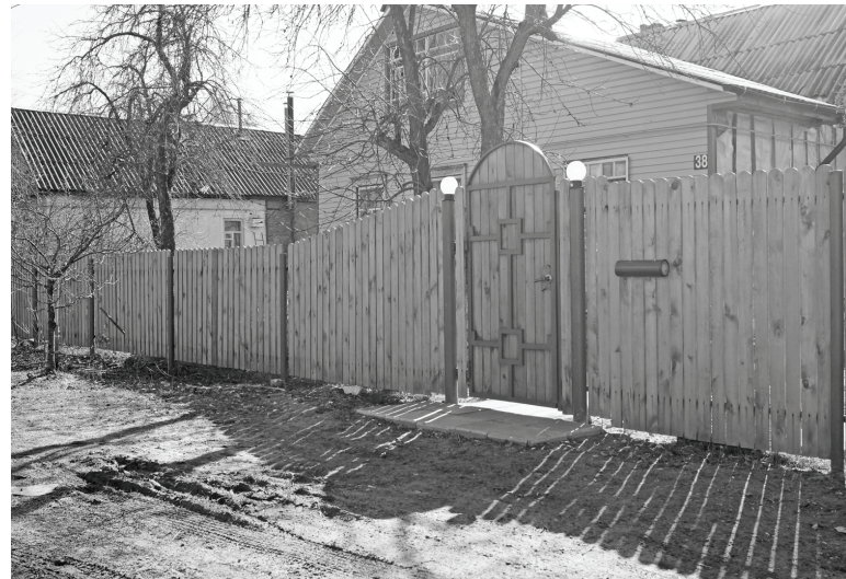
Есть на Пушкинской ухоженные дома, которые радуют глаз.

Написать только о недостатках было бы несправедливо. Ухоженные усадьбы на Пушкина, конечно, есть. Приведу только один пример. Мой гид обратила внимание на дом под номером 38. И правда, он аккуратный, изгородь и калитка вы-