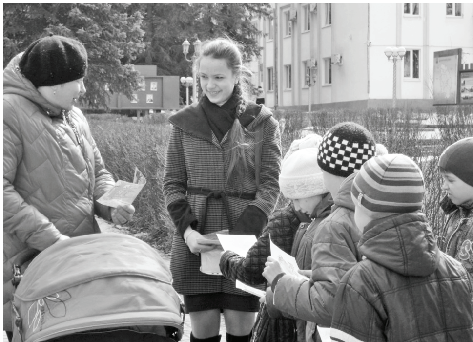
Давайте прислушаемся к нашим детям!